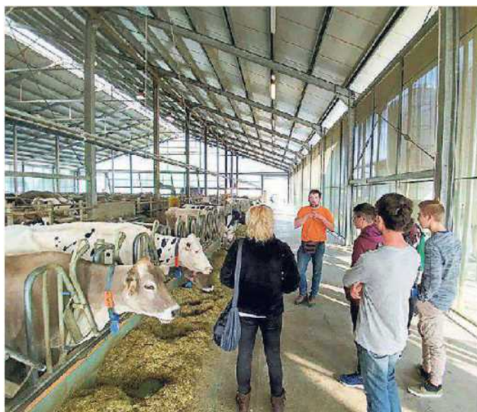
Giovani in visita alla Tipoteca Italiana di Cornuda, in un'azienda di Montebelluna e in una stalla del comprensorio