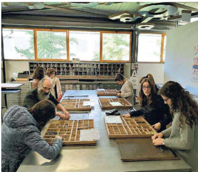
Giovani alla Tipoteca Italiana di Cornuda apprendono i rudimenti del carattere