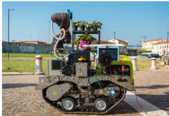
Il robot raccoglie frutta