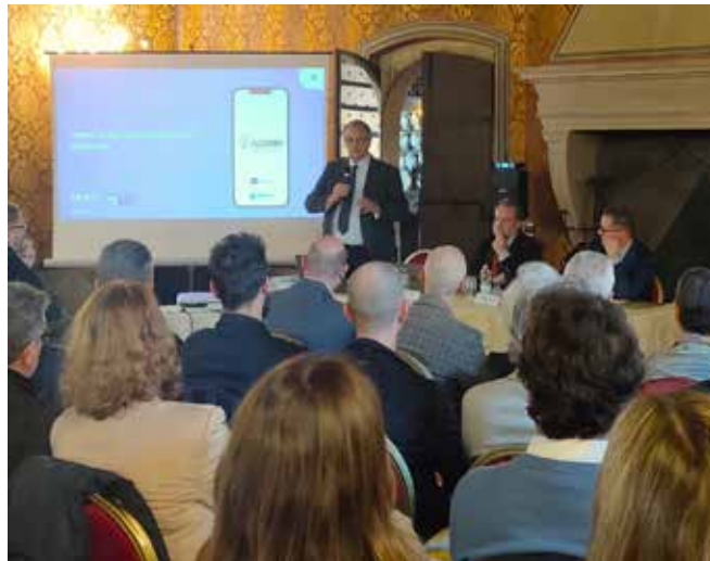
La presentazione in Prefettura