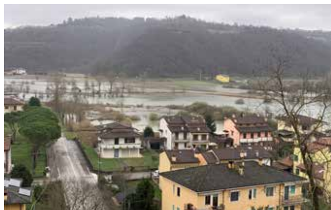
Altavilla vicentina allagamenti 2024